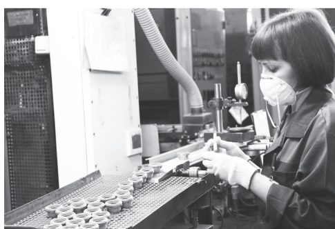
На территории Димитровграда зарегистрировано два индустриальных парка: «ДААЗ» и «ДИП-Мастер». На сегодняшний день только на территории индустриального парка «ДААЗ» работают 12 резидентов.

Напомним: региональным законодательством для управляющих компаний индустриальных парков монопрофильного муниципального образования I категории города Димитровграда предусмотрен пакет нало-